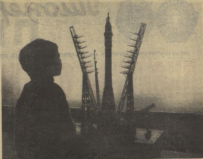
НАШ ВЫСТАВОЧНЫЙ ЗАЛ

Сейчас «Моржонок» стоит в витрине нового магазина «Юный техник». Авторы снегохода продолжают работать: сконструировали микро-